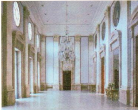
Festsaal der italienischen Botschaft

Landesverband Berlin-Brandenburg Luisenstraße 44, D-10117 Berlin